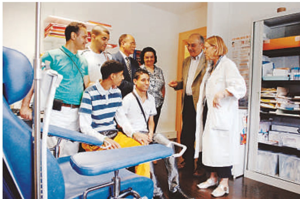
La délégation algérienne, après avoir assisté au congrès et à l'assemblée générale de l'Association française des hémophiles, a visité le Centre régional de traitement de l'hémophilie hier.

En Algérie, même si des progrès ont été enregistrés, les centres spécialisés sont rares et les hémophiles, encore trop souvent vus comme des handicapés suite aux complications articulaires causés par la maladie, peinent à trouver travail et vie de famille. Or des traitements prophylactiques existent. Dispensés sous forme d'injection intraveineuse et pris à temps, ils évitent la déformation douloureuse des articu-